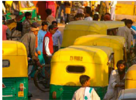
Migranten bij Indiase riksja's.

'In Nederland is het uitzetten van migranten een staatsaangelegenheid'