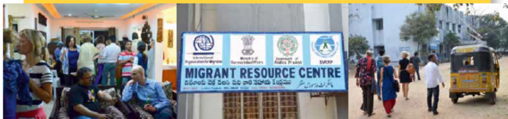
Onderzoekers van het NWO-programma Migration, Development and Conflict ontmoeten elkaar in India en bezochten onder meer de Migrants Right Council.

In januari 2014 ontmoetten alle onderzoekers van het programma elkaar in de Indiase stad Hyderabad. De bijeenkomst werd georganiseerd door WOTRO en het Centre for the Study of Indian Diaspora van de Universiteit van Hyderabad. Drie dagen lang spraken de circa vijftiengint onderzoekers uit Nederland, India en Zuid-Afrika over de voortgang van hun onderzoeksprojecten, waarvan de meeste inmiddels halverwege zijn. Naast feedback op elkaars onderzoeksmethoden en op de voorlopige