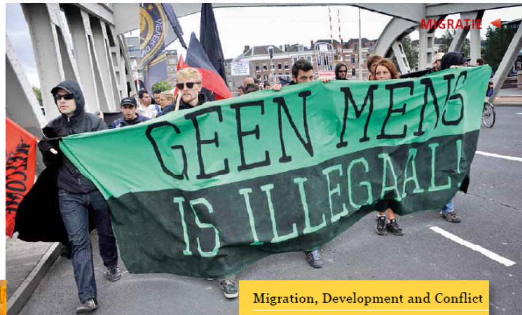
Ongeveer vijfhonderd mensen demonstreerden in 2013 in het centrum van Rotterdam tegen het Nederlandse en Europese vreemdelingenbeleid.